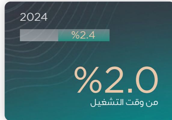
التوقفات غير المخططة للأسمنت الأبيض (UKD)