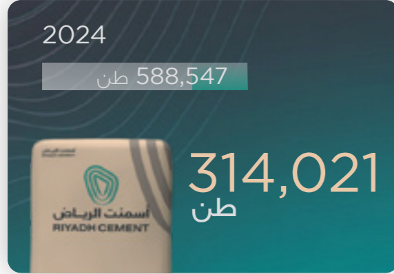
الإنتاج (الكلنكر الأبيض)

وتظل الشركة ملتزمة بالتركيز على التخصيص الرشيد لرأس المال، وتقديم خدمة عملاء متميزة، والالتزام بالتميز التشغيلي بهدف خلق قيمة طويلة الأجل ومستدامة.