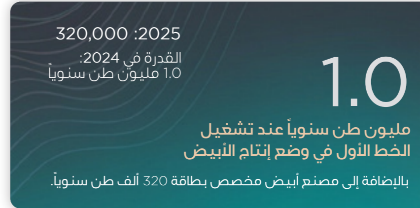
مرونة إنتاج الكلنكر الأبيض