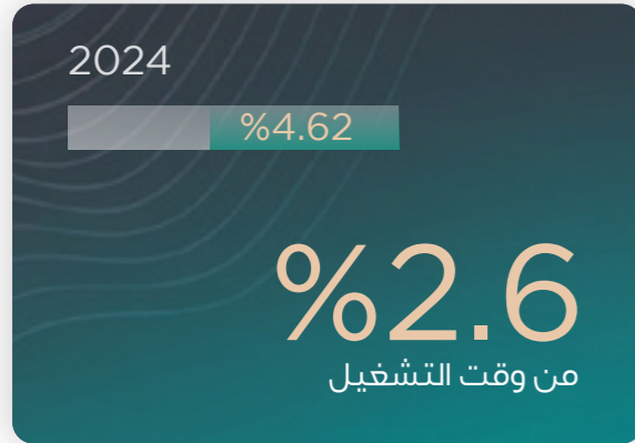
التوقفات غير المخططة للأسمنت الأسود (UKD)