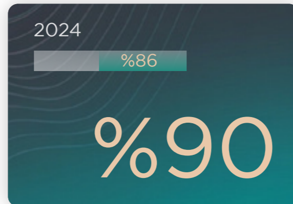
متوسط جاهزية الأفران (الأسود)