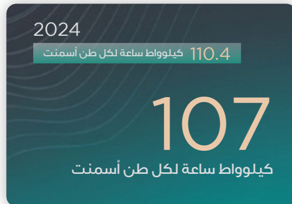
الطاقة النوعية / استهلاك الطاقة