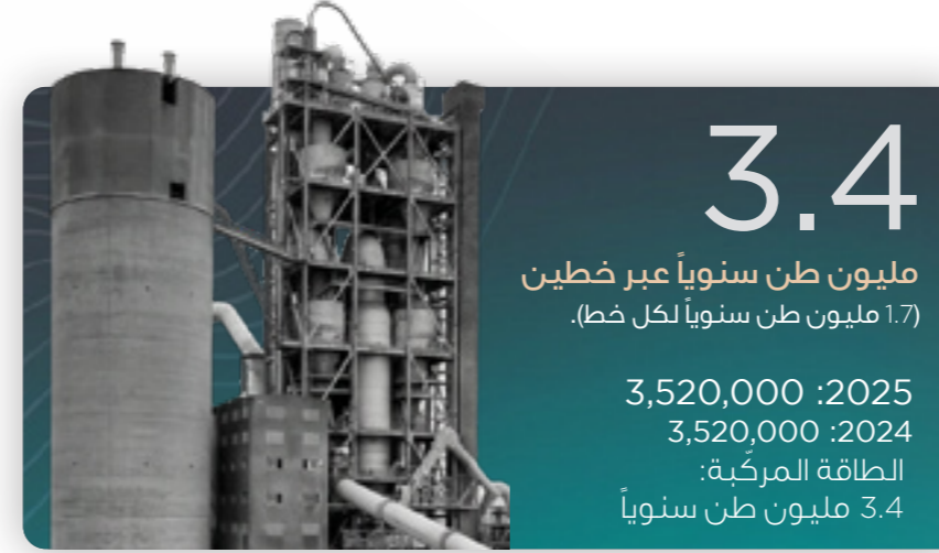
الطاقة التصميمية الكلنكر الأسود